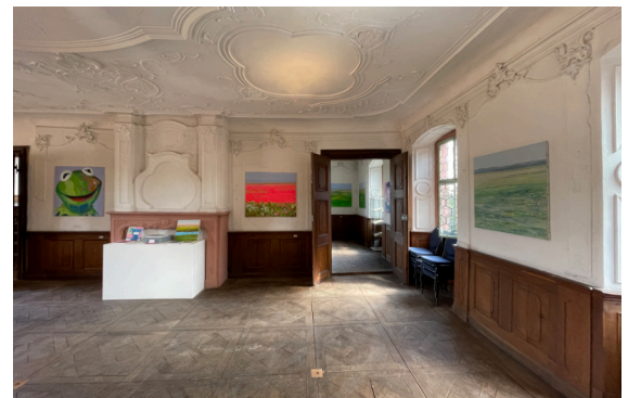
Neues Archiv, Burg Wertheim (Detail)

iban: DE28 4401 0046 0223 2484 66 bic: PBNKDEFF440 bank: Postbank usst-id: DE 124 778 004 venue: Dortmund/Deutschland