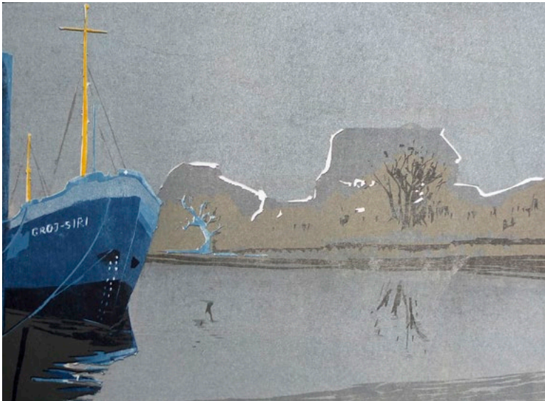
Iris-Jörg · 2019 · Farbholzschnitt · Auflage: jeweils 5 + e.a. · 54 x 76 cm

„... Diese Zeilen lesen sich wie eine Definition ihres eigenen Verständnisses von Landschaft. Denn die Landschaft in ihren zeitgenössischen Erscheinungsformen, sie ist das große Thema im künstlerischen Schaffen von Anastasiya Nesterova. ... Und sie haben eines gemeinsam: