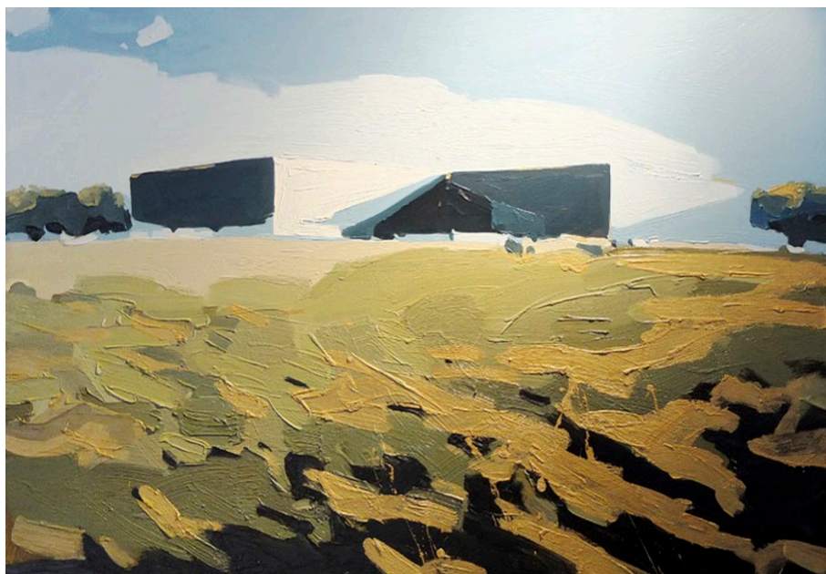
Maschinenhallen VII · 2019 · Ölfarbe auf Leinwand