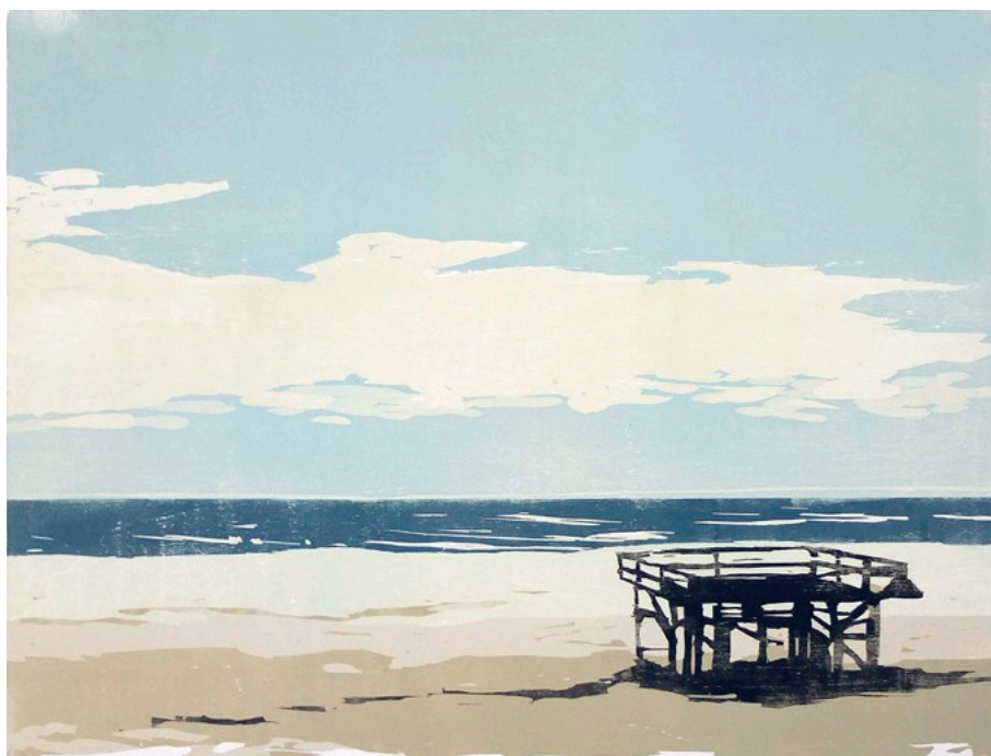
Strandgerüst · 2018 · Farbholzschnitt · Auflage: je 5 + e.a. · 55 x 75 cm