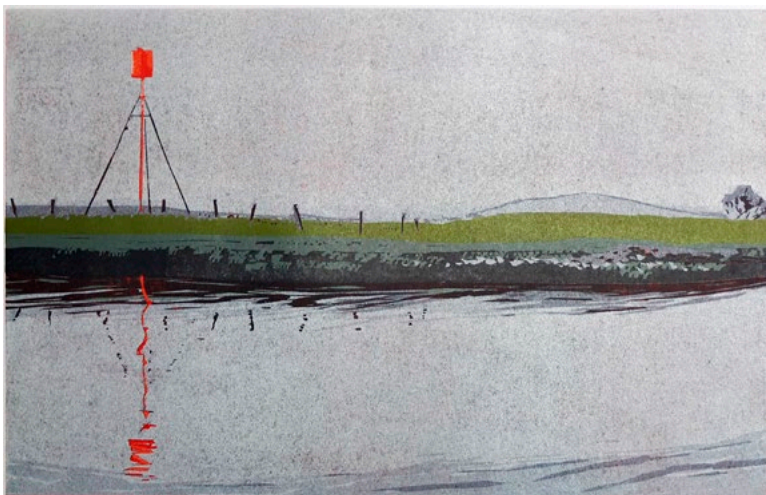
Tagesbrake · 2019 · Farbholzschnitt · Auflage: 5 + e.a. · 54 x 84 cm

Anastasiya Nesterovas Landschaften zeigen nie die unberührte Natur, sie sind nicht inszeniert, idealisiert oder gar romantisch verklärt. Ganz im Gegenteil: Nesterova zeigt uns die Landschaft in ihrer gegenwärtigen Form, in der sie uns umgibt. Als Ergebnis eines Prozesses, den der Mensch, im Positiven wie im Negativen, durch seine Eingriffe im Laufe der Zeit maßgeblich bestimmt hat. Im ländlichen wie im urbanen Raum. Es sind Kulturlandschaften ebenso wie Stadtlandschaften – vom Menschen über Jahrhunderte, manchmal auch nur innerhalb kurzer Zeitspannen für sein Leben geschaffen oder nach seinen Plänen gestaltet. Und obwohl der Mensch selbst in Anastasiya Nesterovas Arbeiten nie zu sehen ist, ist er doch immer präsent.“